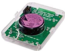
デザインサンプル(DC2126A)