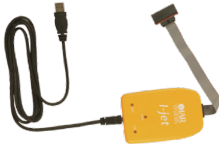
IAR社-Jet On-chip SDK デバッグ用