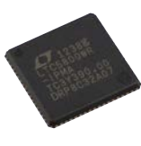
LTC5800-IPR マネージャチップ (QFN)