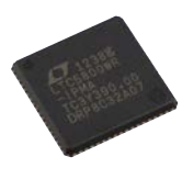
LTC5800-IPM マネージャチップ (QFN)