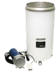
雨量 i-SENSOR2 Rain