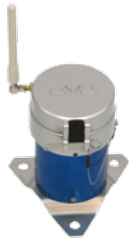
地盤傾斜 i-SENSOR2 Tilt